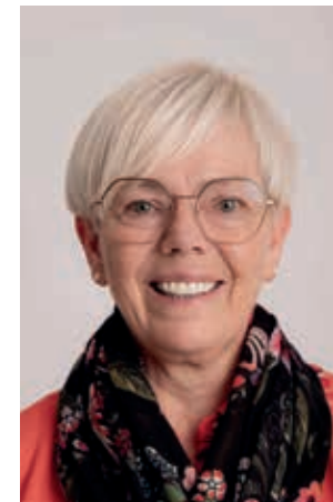
26 Wahlvorschlag Nr. 2

Stimmzettel zur Wahl der Kreisräte im Landkreis Straubing-Bogen am 8. März 2026